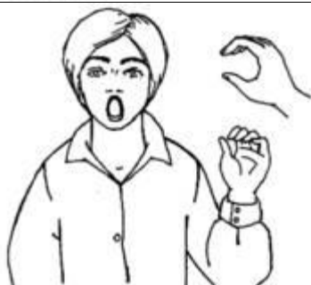
Рис. 3. Ручная поза звука [о] «Хоботок»