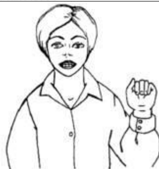
Рис. 4. Ручная поза звука [и] «Заборчик»