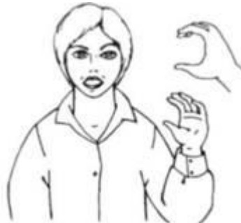
Ручная поза звука [э]