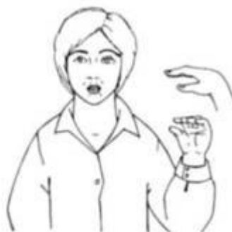
Ручная поза звука [у] «Трубочка»