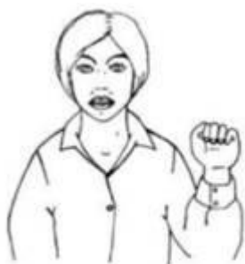
Ручная поза звука [ы]