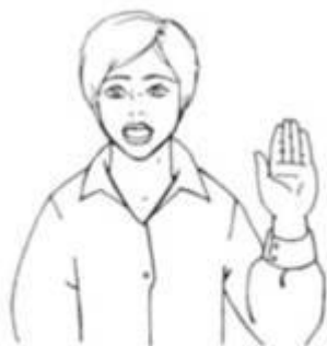
Ручная поза звука [а] «Окошко»